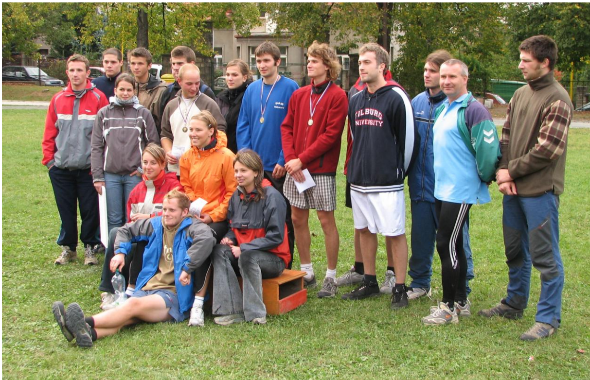
Po desetiboji na Sokoláku, podle kterého se jmenuje celý náš seriál ... 7.10.2006