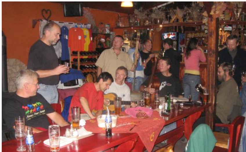
Večerek v místní hospůdce