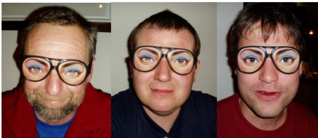
Předvečer lyžařské K70

Na ostatní jsem si nevzpomněl, můžete si je sem dopsat sami ☺