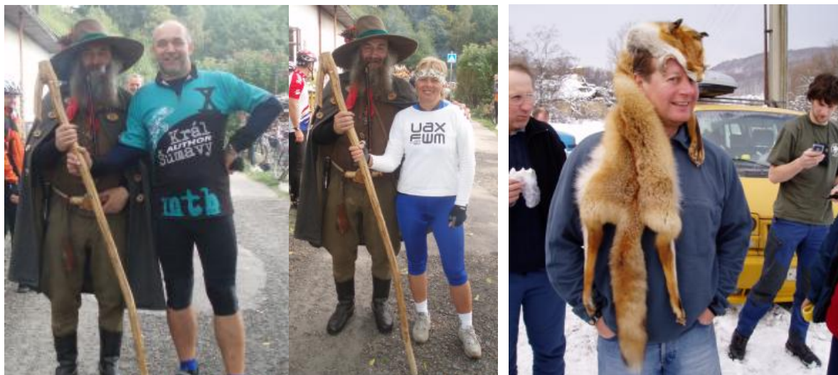
Král Šumavy bude prý nahrazen králem Krkonoš