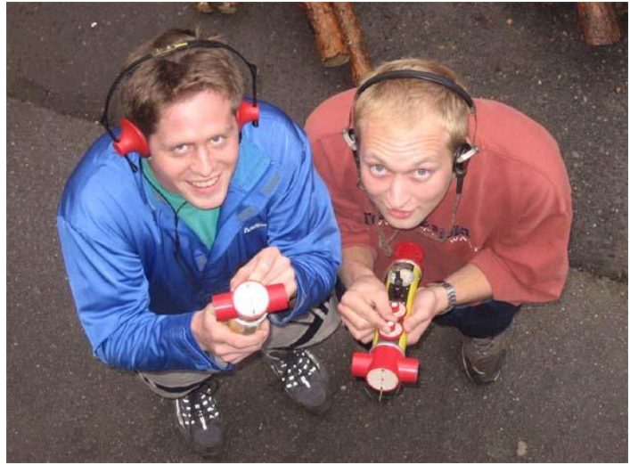
Při MTBO bohužel nikdo nefotil, ale za zmínku určitě stojí i odpolední Prakinův radiový orientační běh (viz klip Kryštof – Rubikon ©)