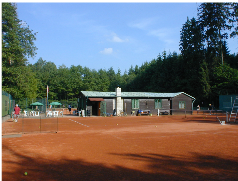
Dějiště turnaje - kurty TK Radošovice