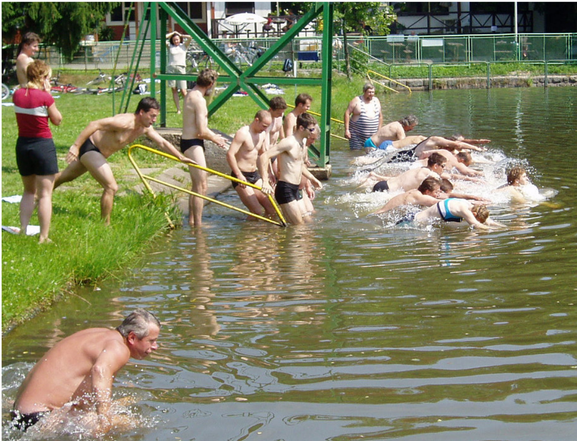
Robátko vrhající se do hlubin