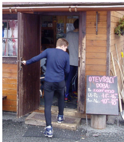
... a zase rychle dovnitř.