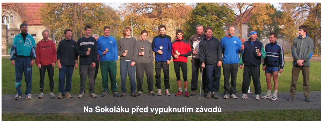
Na Sokoláku před vypuknutím závodů