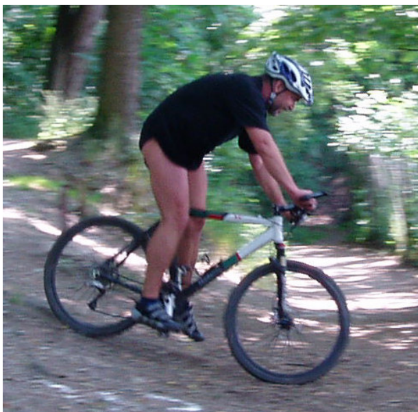
Neznámý závodník z konce startovního pole