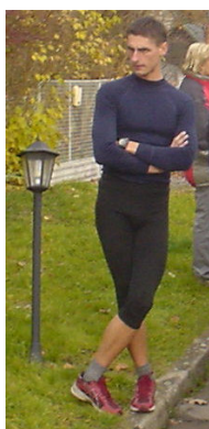
Kde jsem to po...?