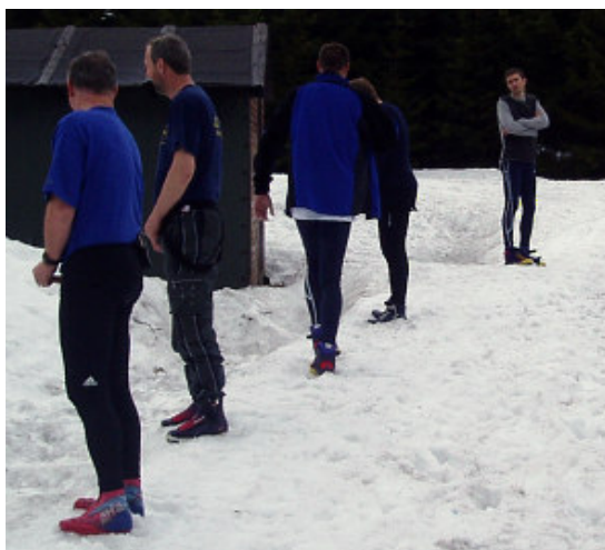
Na chvíli se nadýcháme horského vzduchu ...

Počasí : zataženo, sněžení, něco nad nulou