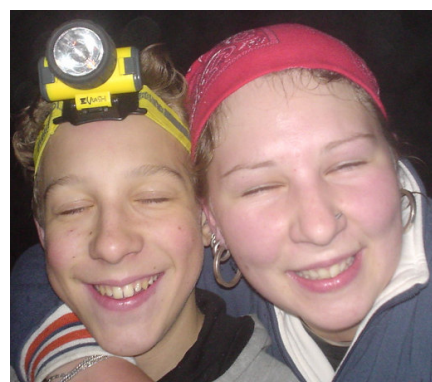
Před nočním lahvácem