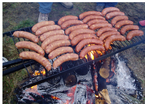
Nejen sportem živ je člověk ...